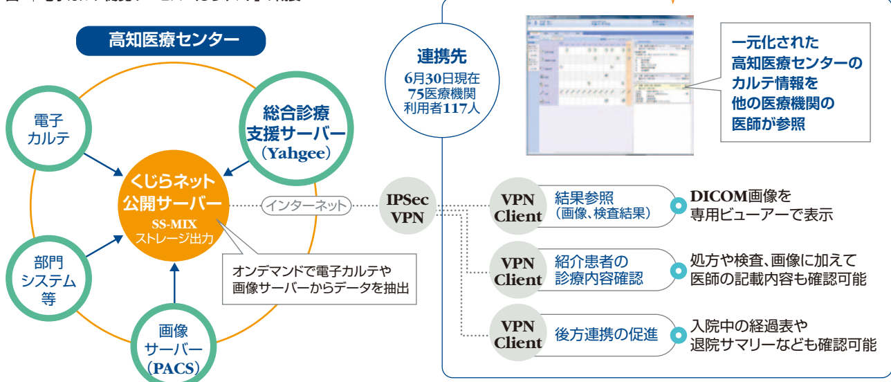
図2 | 電子カルテ閲覧サービス「くじらネット」の概要

高知医療センターを起点とした地域医療ネットワークを構築し、連携医療機関から、診療情報や放射線画像の参照を可能にした。