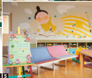
1 正門方向から見た外観 2、3 看護師のほか薬剤師や栄養士も常駐するスタッフステーション 4 小児病棟の壁に飾られた人形で子供の患者さんは自分の居場所を認識する 5 小児病棟にある「ホープさんの部屋」