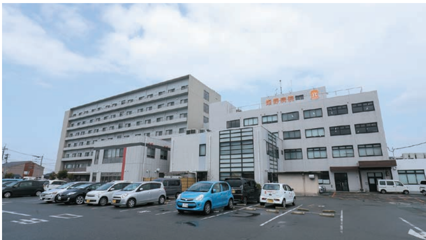
病院の外観。新病棟は多床室を廃止し、すべて個室にした。敷地内に有料老人ホームを開設している

宅にいられなくなった場合の受け入れだ。急性期に特化した病院の負担を減らせるように連携する。