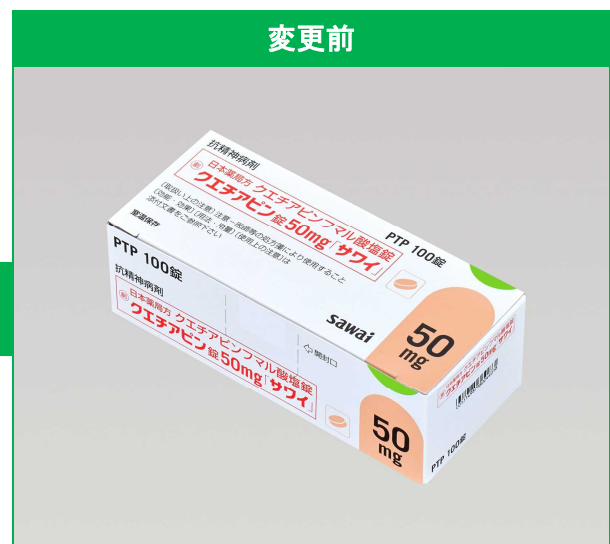
サイズ 45 (タテ) × 105 (ヨコ) × 34 (高さ) <mm>